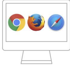
PC and Mac Chrome | Firefox | Safari

1 استخدم جهاز كمبيوتر أو جهاز مزود بكاميرا / ميكروفون